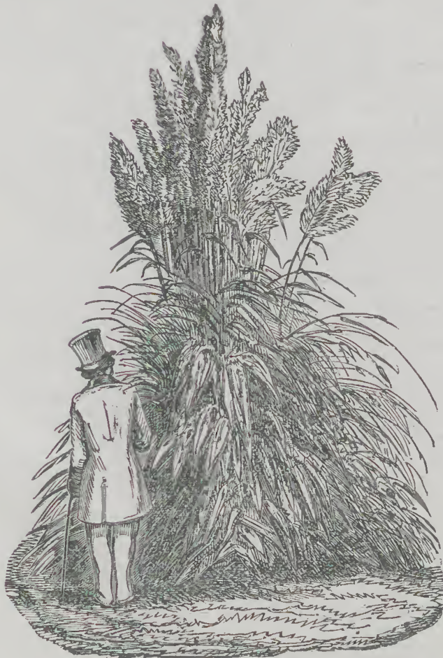
GYNERIUM ARGENTEUM. — 50 centimes à 2 francs.